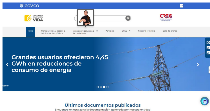
Ilustración 1 Página principal de la CREG

Paso 1: Ingrese a la página de la CREG en https://creg.gov.co