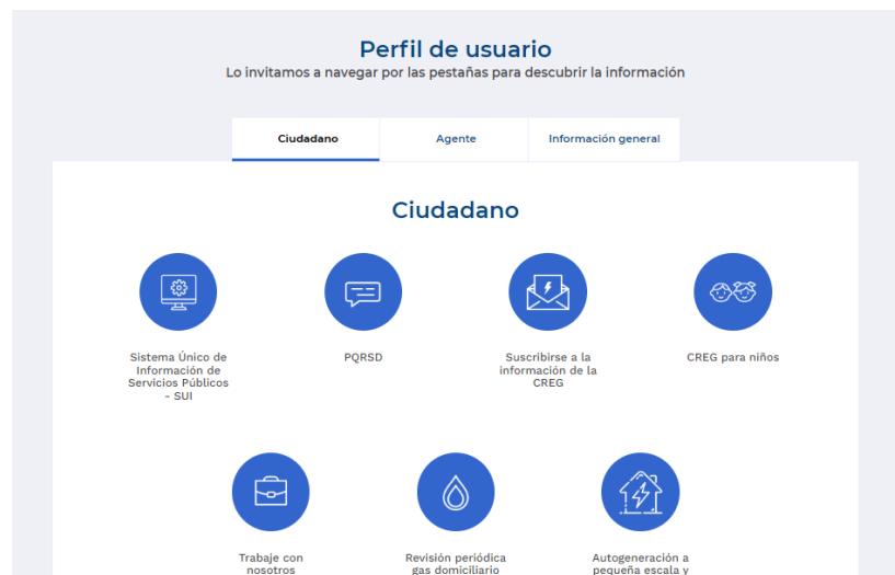
Ilustración 2 Sección perfil de usuario

Paso 2: Diríjase a la parte inferior de la página, hasta la sección “Perfil de usuario”.