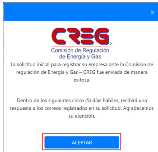
Ilustración 11 Ventana emergente de confirmación de envío de la solicitud.

Paso 9: Por último, haga clic en el botón aceptar en la ventana emergente que indica que la solicitud fue enviada correctamente.