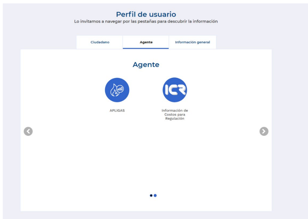
Ilustración 4 Sección Agente – Página principal de la CREG