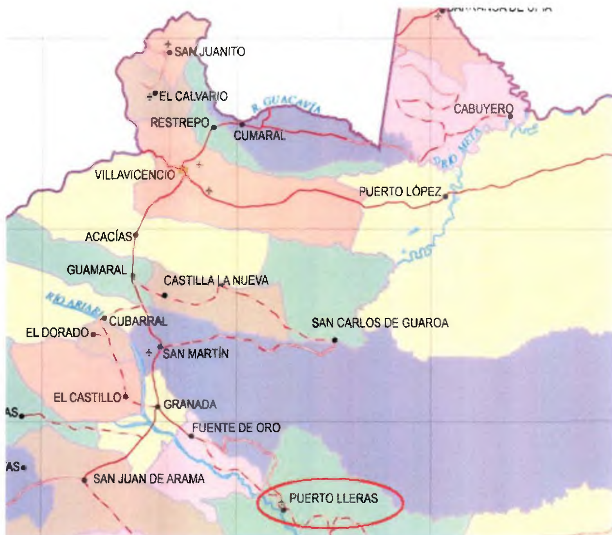
Figura 1. Diagrama de la ubicación geográfica del Sistema de Distribución

Mediante la Resolución CREG-011 de 2003 (en adelante Resolución 11 ), la Comisión aprobó los principios generales y la metodología para el establecimiento del cargo por uso del Sistema de Distribución y del Cargo de Comercialización de gas combustible por redes a usuarios regulados. La Resolución 11 estableció igualmente la información requerida para el cálculo de los cargos por uso del Sistema de Distribución y Cargo de Comercialización.