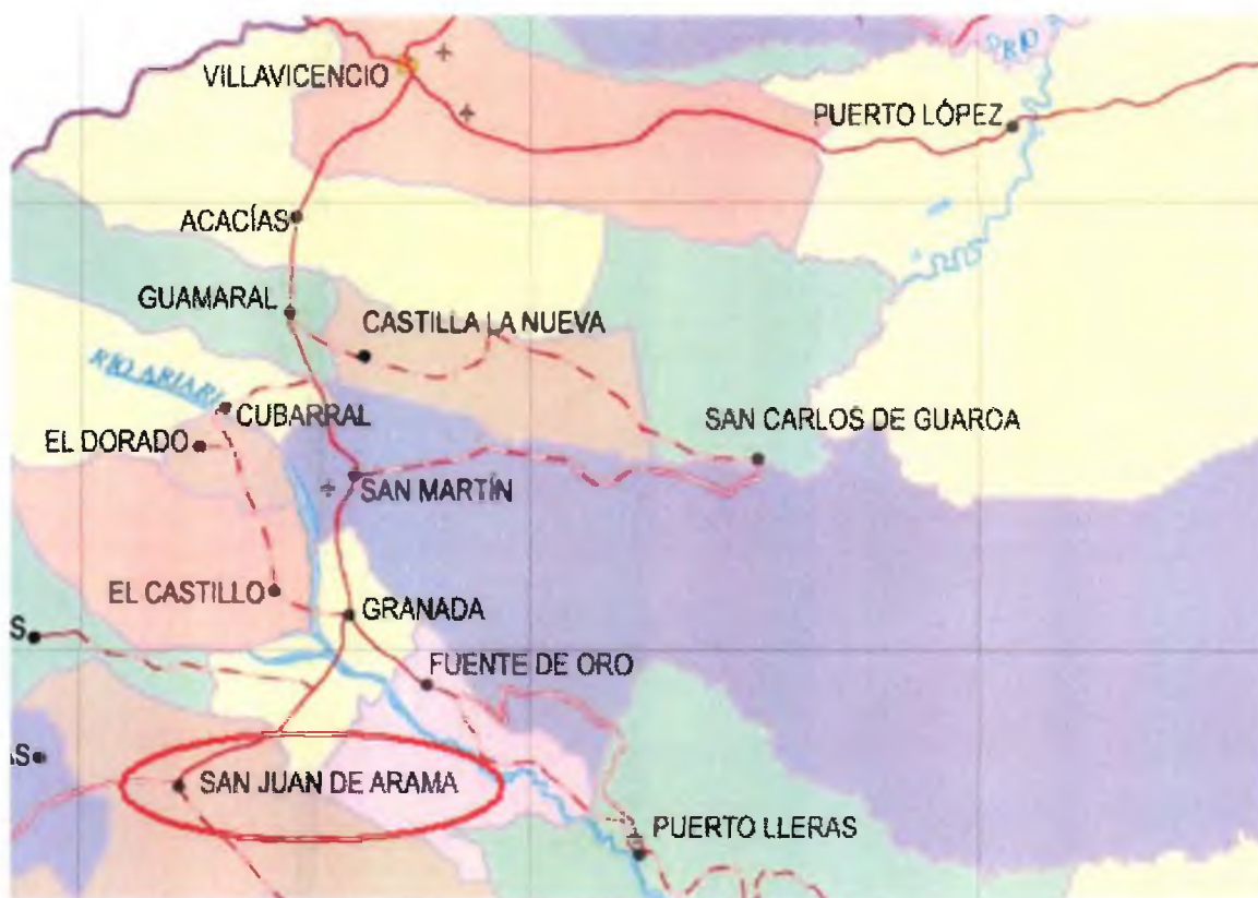
Figura 1. Diagrama de la ubicación geográfica del Sistema de Distribución

Mediante la Resolución CREG-011 de 2003 (en adelante Resolución 11 ), la Comisión aprobó los principios generales y la metodología para el establecimiento del cargo por uso del Sistema de Distribución y del Cargo de Comercialización de gas combustible por redes a usuarios regulados. La Resolución 11 estableció igualmente la información requerida para el cálculo de los cargos por uso del Sistema de Distribución y Cargo de Comercialización.