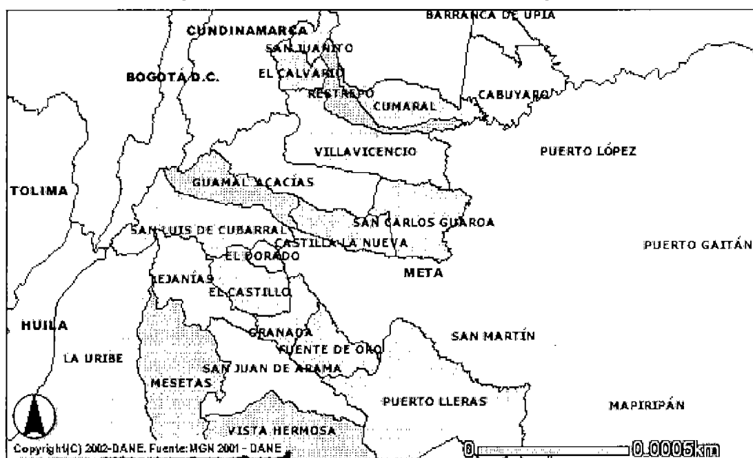
Esquema del Área de Influencia de la Empresa

Los cargos de distribución vigentes para MADIGAS corresponden a los aprobados por la Comisión mediante Resoluciones CREG 260 de 1997 y 045 de 2001. Para el municipio de Acacías se aprobó un cargo promedio de $80,96/m 3 expresado en valores de diciembre de 1997 (Resolución CREG 260 de 1997). Por otra parte para los municipios de Paratebueno (Cundinamarca), Castilla La Nueva, Fuente de Oro, Guamal, Puerto López y San Martín (Meta) se aprobó un cargo de distribución de $223,65/m 3 , expresado en valores de diciembre de 2000.