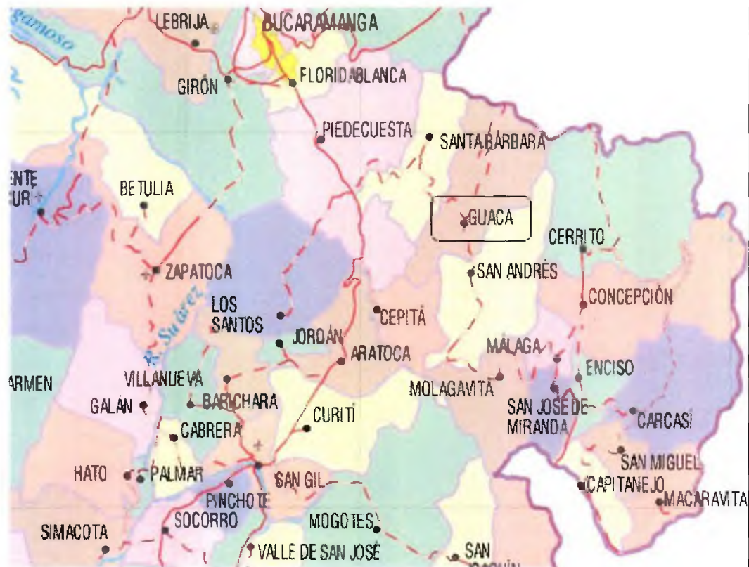
Figura 1. Diagrama de la ubicación geográfica del Sistema de Distribución

Mediante la Resolución CREG-011 de 2003 (en adelante Resolución 11 ), la Comisión aprobó los principios generales y la metodología para el establecimiento del cargo por uso del Sistema de Distribución y del Cargo de Comercialización de gas combustible por redes a usuarios regulados. La Resolución 11 estableció igualmente la información requerida para el cálculo de los Cargos por uso del Sistema de Distribución y Cargo de Comercialización.