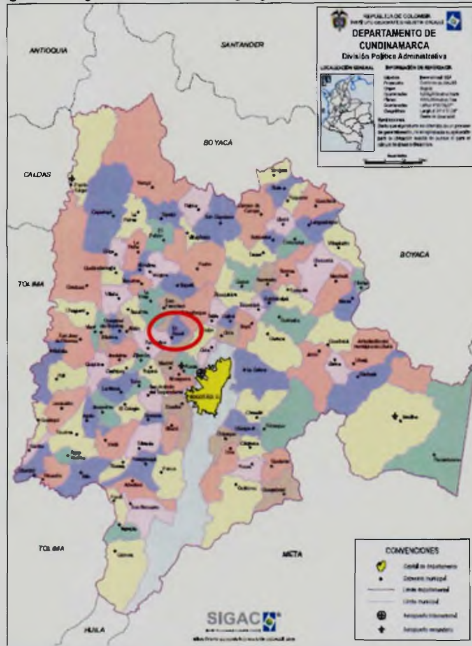
Figura 1. Diagrama de la ubicación geográfica del Sistema de Distribución