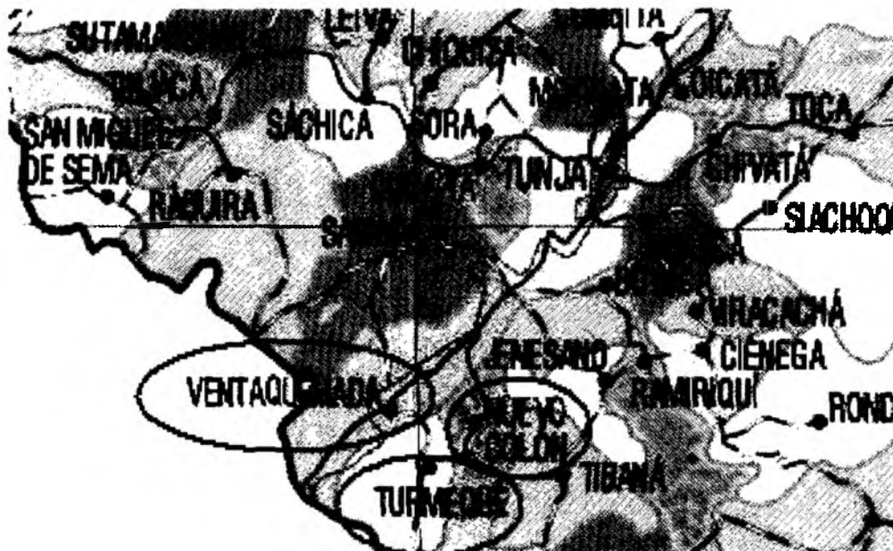
Figura 1. Diagrama de la ubicación geográfica del Sistema de Distribución

Mediante la Resolución CREG-011 de 2003 (en adelante Resolución 11 ), la Comisión aprobó los principios generales y la metodología para el establecimiento del cargo por uso del Sistema de Distribución y del Cargo de Comercialización de gas combustible por redes a usuarios regulados. La Resolución 11 estableció igualmente la información requerida para el cálculo de los cargos por uso del Sistema de Distribución y Cargo de Comercialización.