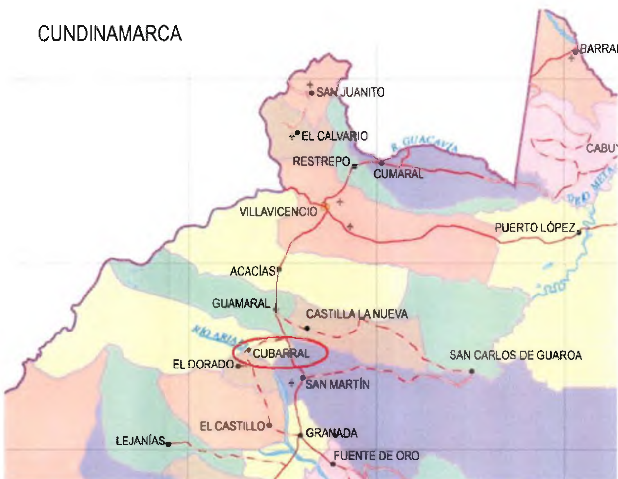
Figura 1. Diagrama de la ubicación geográfica del Sistema de Distribución

Mediante la Resolución CREG-011 de 2003 (en adelante Resolución 11 ), la Comisión aprobó los principios generales y la metodología para el establecimiento del cargo por uso del Sistema de Distribución y del Cargo de Comercialización de gas combustible por redes a usuarios regulados. La Resolución 11 estableció igualmente la información requerida para el cálculo de los cargos por uso del Sistema de Distribución y Cargo de Comercialización.