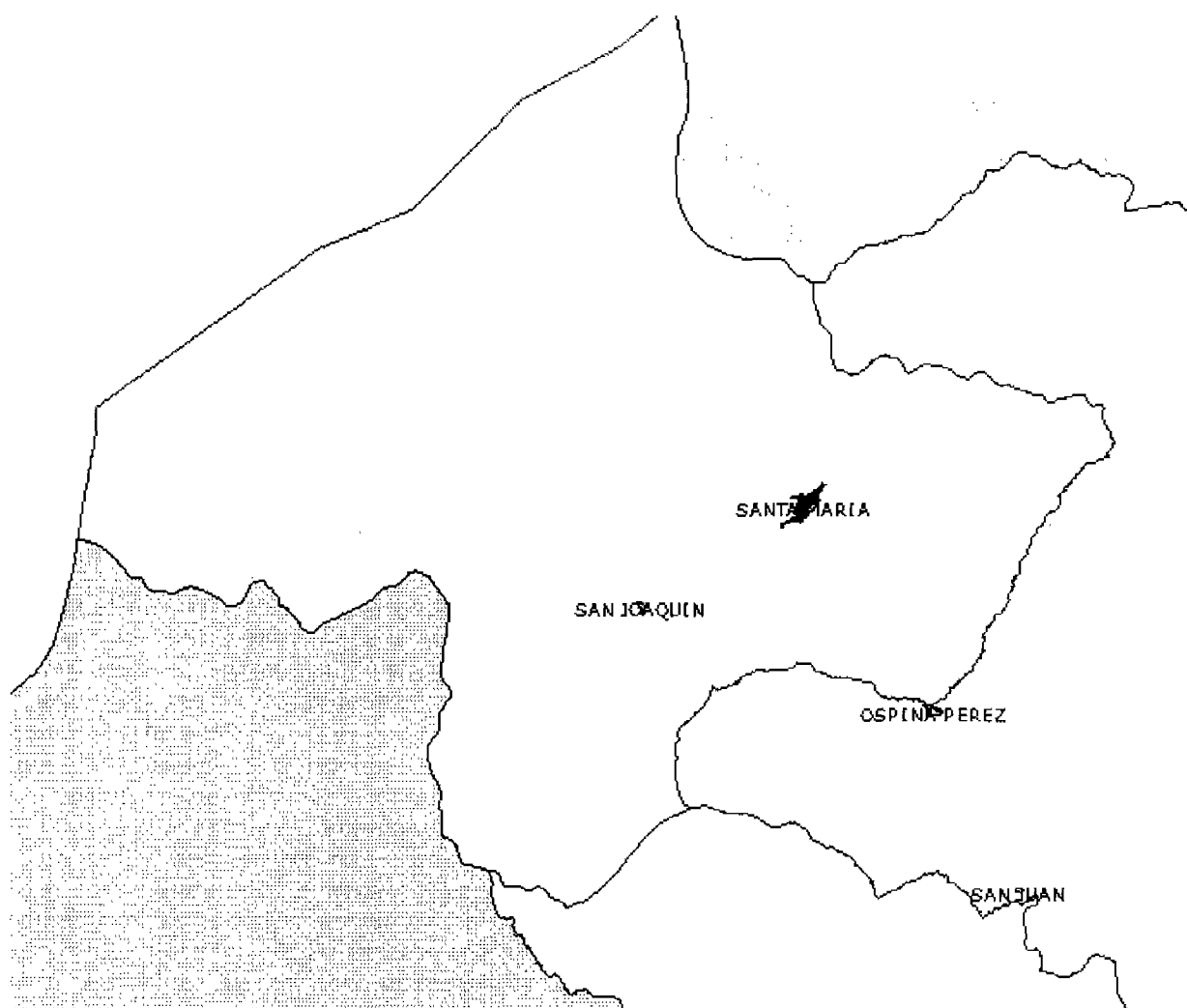
Figura 1. Diagrama de la ubicación geográfica del Sistema de Distribución

Mediante la Resolución CREG-011 de 2003 (en adelante Resolución 11 ), la Comisión aprobó los principios generales y la metodología para el establecimiento del cargo por uso del Sistema de Distribución y del cargo de comercialización de gas combustible por redes a usuarios regulados. La Resolución 11 estableció igualmente la información requerida para el cálculo de los cargos por uso del Sistema de Distribución y cargo de comercialización.