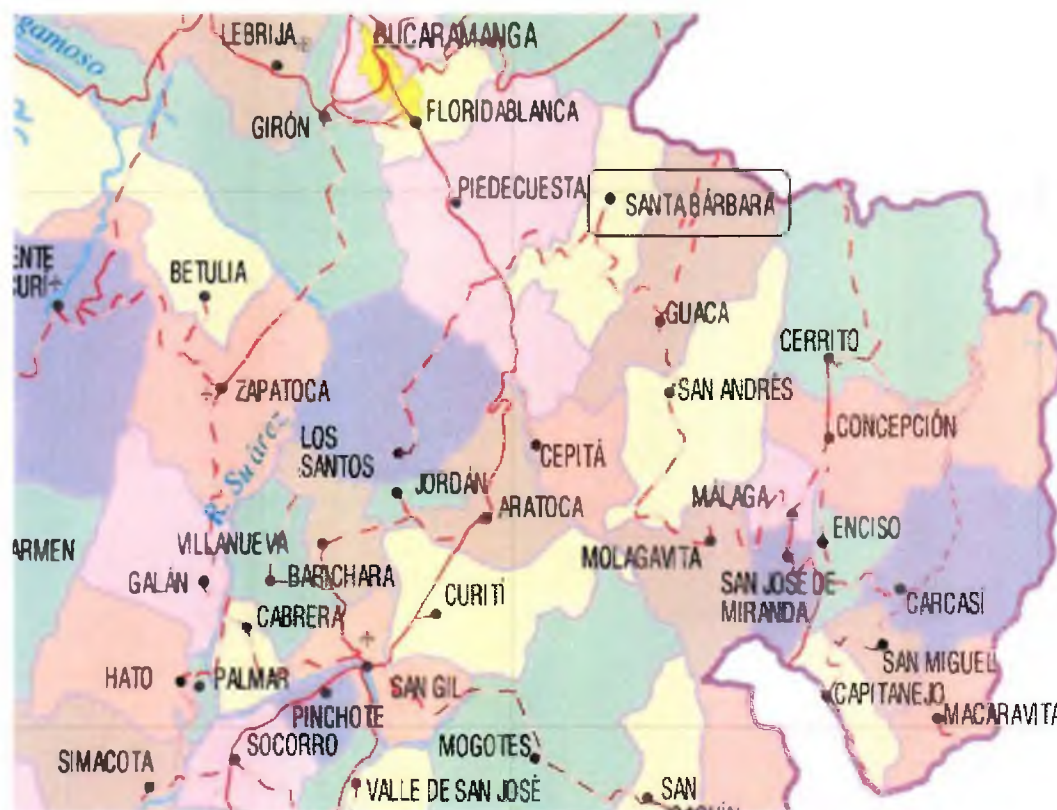
Figura 1. Diagrama de la ubicación geográfica del Sistema de Distribución

Mediante la Resolución CREG-011 de 2003 (en adelante Resolución 11 ), la Comisión aprobó los principios generales y la metodología para el establecimiento del cargo por uso del Sistema de Distribución y del Cargo de Comercialización de gas combustible por redes a usuarios regulados. La Resolución 11 estableció igualmente la información requerida para el cálculo de los cargos por uso del Sistema de Distribución y Cargo de Comercialización.