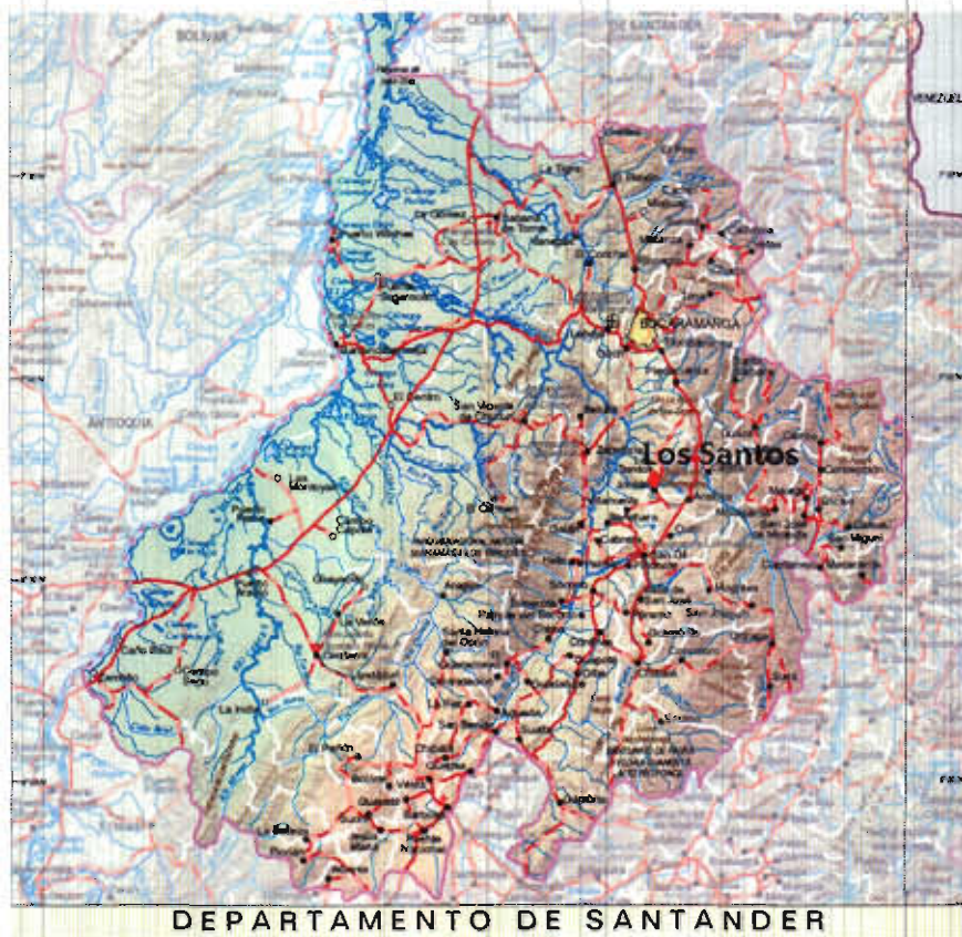
Figura 1. Diagrama de la ubicación geográfica del Sistema de Distribución

A continuación se muestra la ubicación de los municipios de la solicitud.