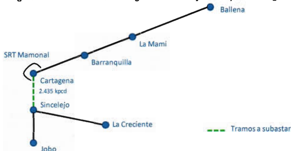
Figura 2. Tramo a subastar según solicitud ajustada por Promigas