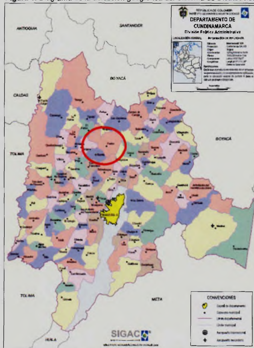
Figura 1. Diagrama de la ubicación geográfica del Sistema de Distribución