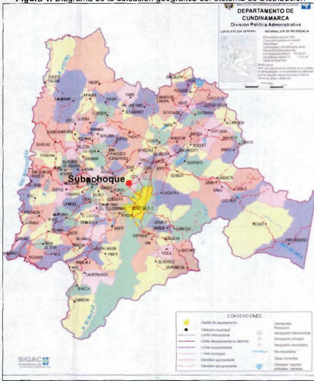
Figura 1. Diagrama de la ubicación geográfica del Sistema de Distribución