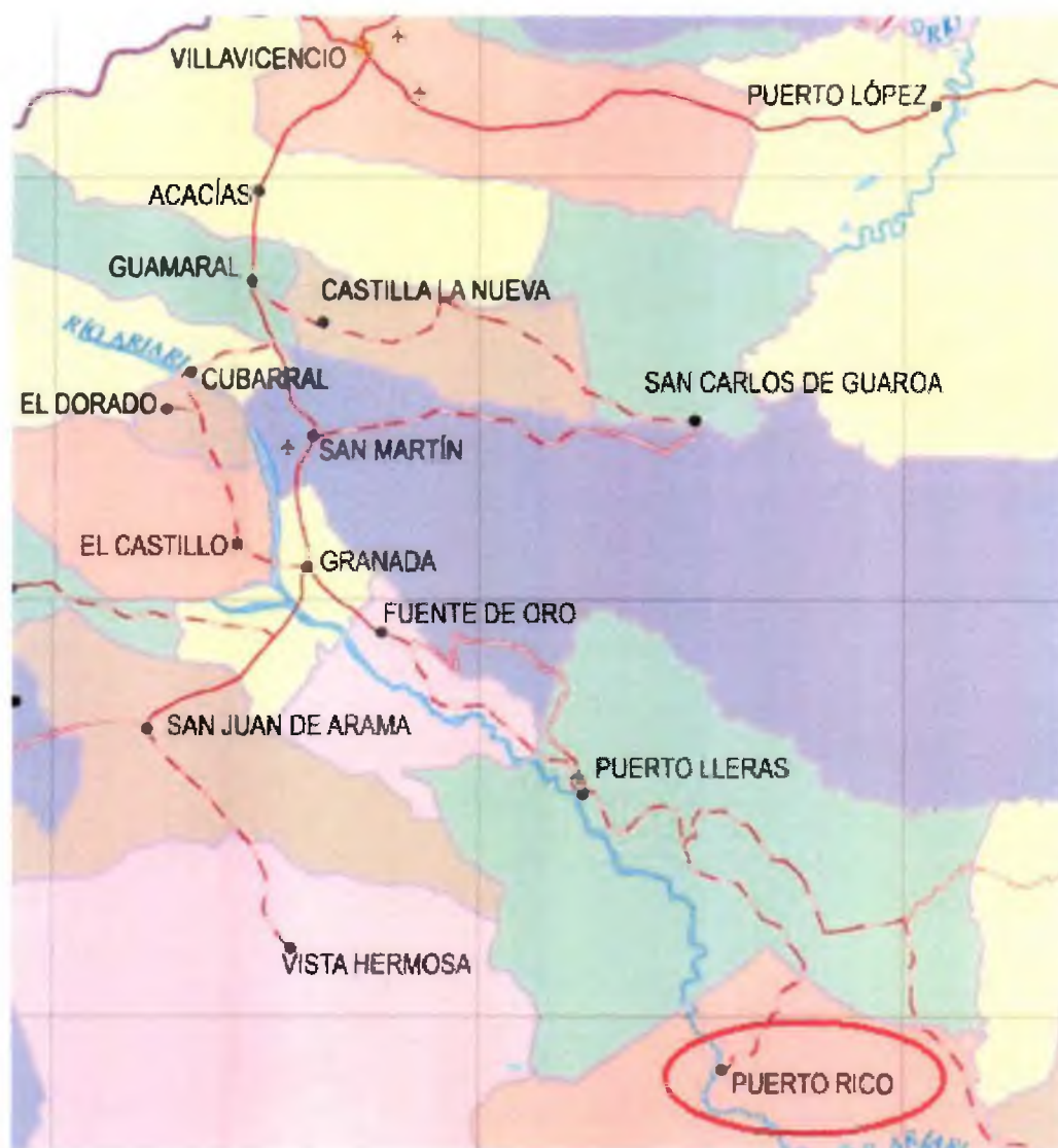
Figura 1. Diagrama de la ubicación geográfica del Sistema de Distribución

Mediante la Resolución CREG-011 de 2003 (en adelante Resolución 11 ), la Comisión aprobó los principios generales y la metodología para el establecimiento del cargo por uso del Sistema de Distribución y del Cargo de Comercialización de gas combustible por redes a usuarios