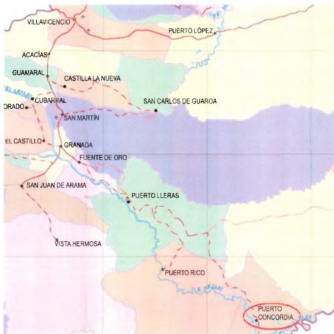
Figura 1. Diagrama de la ubicación geográfica del Sistema de Distribución

Mediante la Resolución CREG-011 de 2003 (en adelante Resolución 11 ), la Comisión aprobó los principios generales y la metodología para el establecimiento del cargo por uso del Sistema de Distribución y del Cargo de Comercialización de gas combustible por redes a usuarios